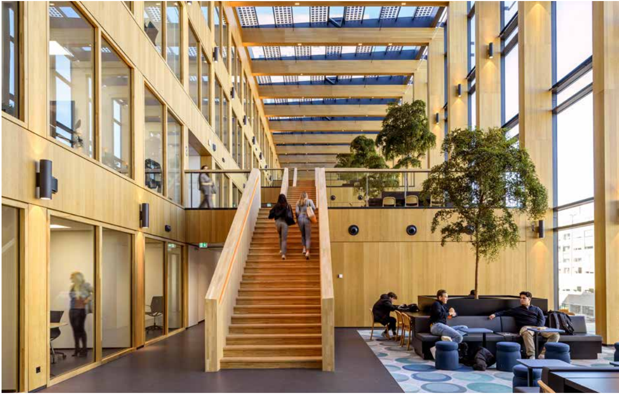
FOTO BOVEN Direct aan de gevel van het atrium liggen opvallende houten trappen die de verdiepingen en studiepleinen met elkaar verbinden.