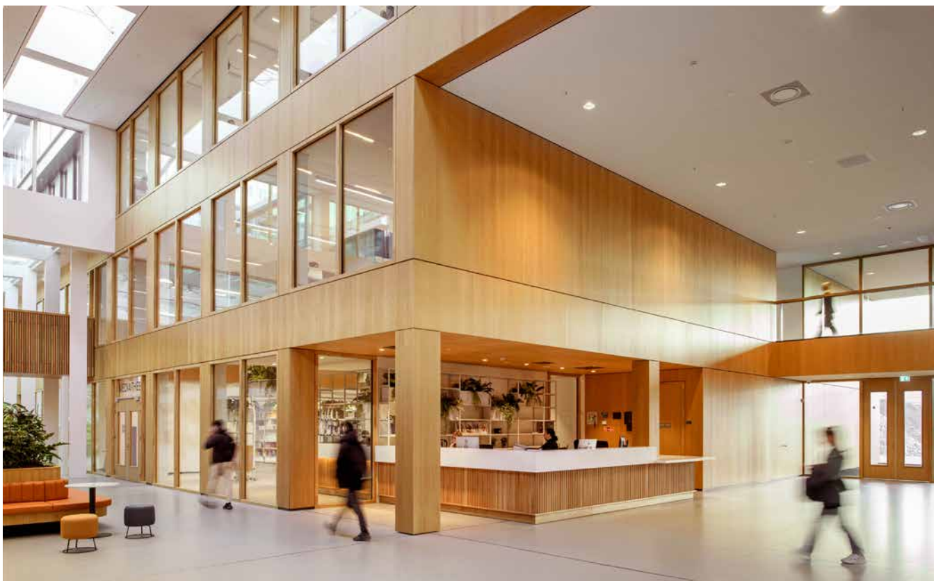
FOTO ONDER Het entreegebied is een van de vijf 'showcases'-plekken die het visitekaartje vormen van de faculteit.

FOTO BOVEN Dankzij de transparante gevel is er vanaf de campus goed zicht op de activiteiten binnen.