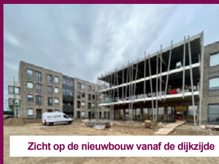
Zicht op de nieuwbouw vanaf de dijkzijde

Het nieuwe pand eind juni, vlak na de oplevering. Inmiddels zijn de sloopwerkzaamheden aan het oude gebouw gestart en wordt er op het terrein van de nieuwbouw gewerkt aan de verdere realisatie van het plan.