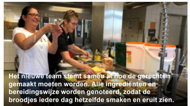
Het nieuwe team stemt samen af hoe de gerechten gemaakt moeten worden. Alle ingrediënten en bereidingswijze worden genoteerd, zodat de broodjes iedere dag hetzelfde smaken en eruit zien.