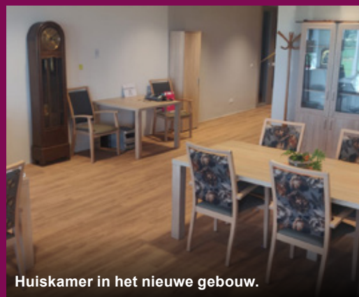
Huiskamer in het nieuwe gebouw.