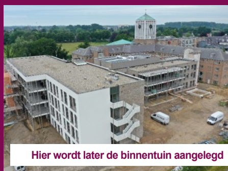
Hier wordt later de binnentuin aangelegd

De laatste elementen van 'De Ark' werden in augustus verwijderd.