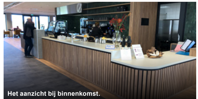
Het aanzicht bij binnenkomst.