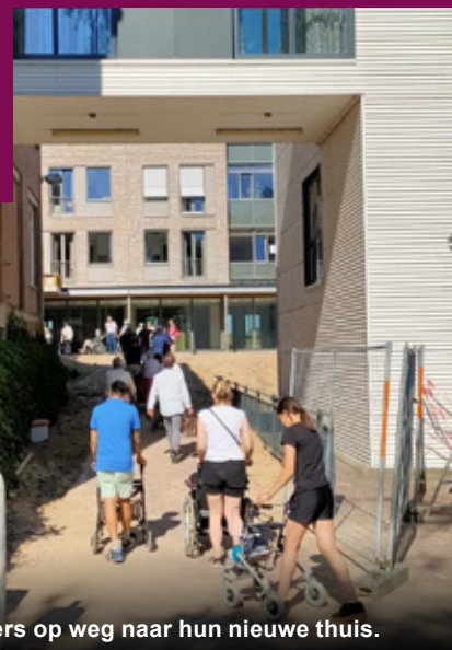
Bewoners op weg naar hun nieuwe thuis.

In juni is de eerste fase van het nieuwbouwplan van Sint Anna opgeleverd. Er is daarna met man en macht gewerkt, schoongemaakt en ingericht om de verhuizing voor de zomerperiode te kunnen realiseren.