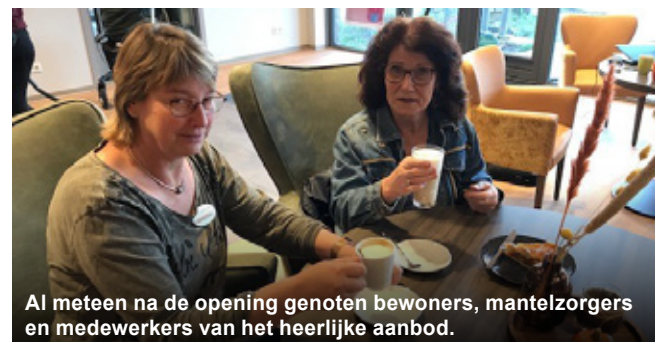
Al meteen na de opening genoten bewoners, mantelzorgers en medewerkers van het heerlijke aanbod.