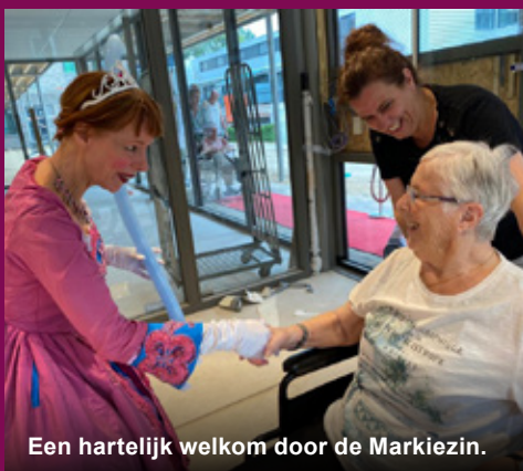
Een hartelijk welkom door de Markiezin.