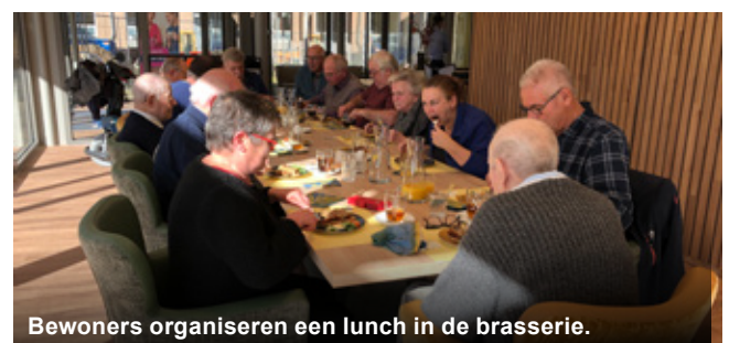
Bewoners organiseren een lunch in de brasserie.

Bij het bouwen van de eerste fase van de nieuwbouw is ook de brasserie gerealiseerd. De keuken en alle apparatuur was na de verhuizing nog niet aanwezig, maar het overige meubilair al wel. Zo kon de brasserie al kleinschalig in gebruik genomen worden. Nadat de keuken en de balie geïnstalleerd waren kon op 26 september de brasserie écht van start. Al maanden stond het team te popelen om te beginnen. In de periode voordat de brasserie open was hebben zij de kaart samengesteld en natuurlijk alle gerechten uitgeprobeerd en verfijnd. De brasserie is te vinden in de nieuwbouw van Sint Anna aan de Veerstraat 49a. Bewoners, medewerkers, maar ook familie en buurtbewoners of andere ouderen uit Boxmeer en omgeving zijn van harte welkom in de brasserie.