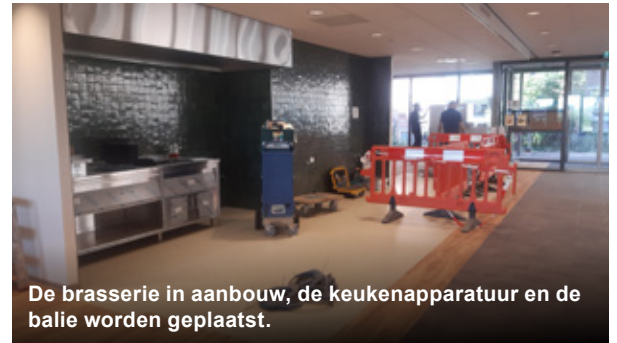
De brasserie in aanbouw, de keukenapparatuur en de balie worden geplaatst.