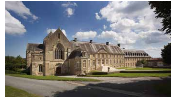
Het moederhuis van de Zusters van Julie Postel in Saint-Sauveur-le-Vicomte.

In juni van dit jaar zijn de eerste 58 bewoners verhuisd. Per bewoner is een persoonlijk verhuisplan opgesteld. "Om bewoners voor te bereiden op de verhuizing hebben we een boekje gemaakt met daarin levens-echte tekeningen van alle ruimtes in het nieuwe gebouw. Die boekjes zijn door onze medewerkers doorgenomen met de bewoners, zodat ze de nieuwe omgeving na de verhuizing herkenden. Het is mooi om nu te constateren dat de realiteit ook écht is zoals we op de tekeningen al konden laten zien."