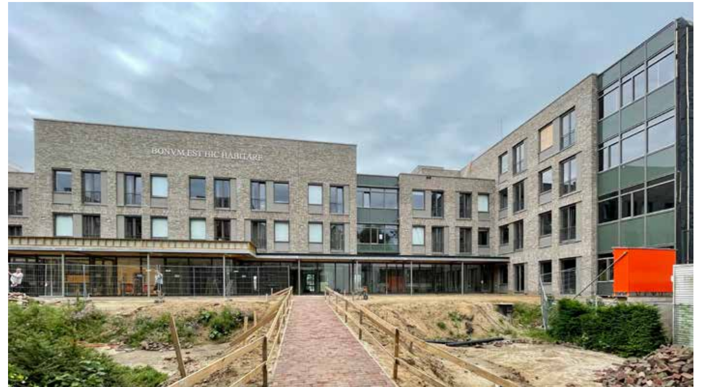
Aanzicht van de gevel. De tekst in Latijn is een verwijzing naar de geschiedenis van de Zusters van Julie Postel en de religieuze achtergrond van Sint Anna. Bonum est hic habitare betekent 'Het is hier goed wonen'.

Een andere uitdaging bleek de leefomgeving van enkele beschermde diersoorten zoals huismussen, bevers, wezels en dwergvleermuizen.