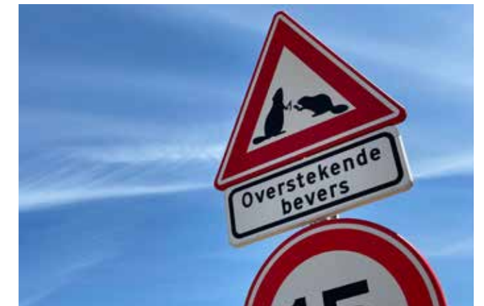
Uitdagingen tijdens de bouw zijn ook op humoristische wijze aangepakt.