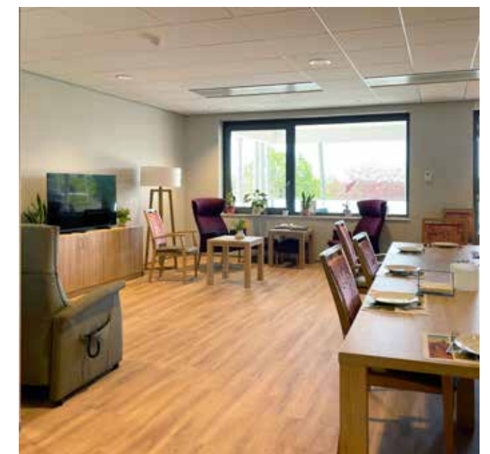
De gezellig ingerichte huiskamers zorgen voor een familiale sfeer en geven bewoners een huiselijk en vertrouwd gevoel. (Beeld: Architectenbureau De Witte Oss)