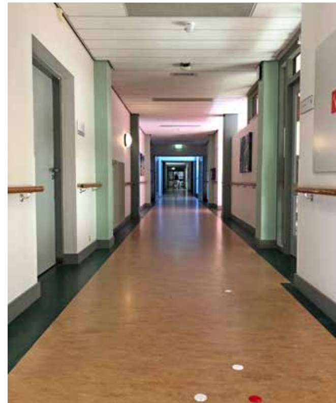
De lange gangen in het oude gebouw geven het gevoel dat je in een ziekenhuis bent.