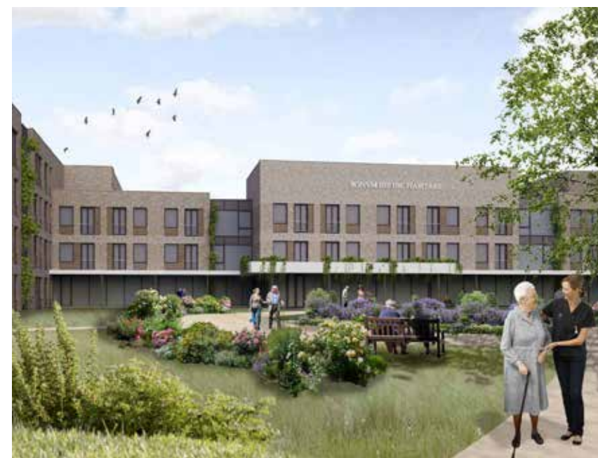
Het vele groen zorgt voor een healing environment. (Beeld: Bouwbedrijf Berghege; Architectenbureau De Witte Oss)