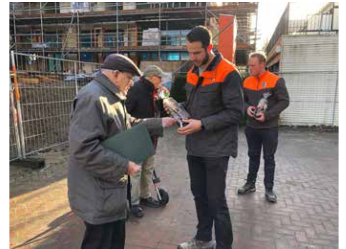
De viering van een mijlpaal; een groep bewoners overhandigde na het bereiken van het hoogste punt het traditionele 'pannenbier'.