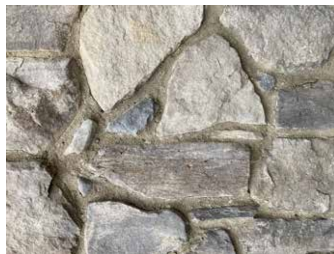
Het bouwproject wordt afgerond door het plaatsen van de Normandische plint, een verwijzing naar het moederhuis van de Zusters van Julie Postel.