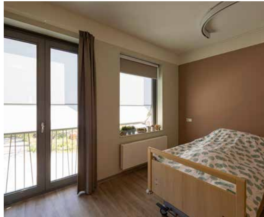
ClimaRad Sensa H2X ventilatie-units in alle zorgkamers van St. Anna.

Elke woonkamer beschikt over een Sensa H2X warmteterugwinunit die continu de luchtkwaliteit in de ruimte meet. Door slimme sensoren weet het systeem precies wanneer en hoeveel ventilatie benodigd is. De badkamer-fan beschikt over een bewegings- en vochtsensor en werkt volledig draadloos samen met de unit in de woonkamer voor een juiste balans. Hans: "Voor extra comfort kan bij warm weer 's nachts koele lucht toegevoerd worden, de badkamer zal dan automatisch warme lucht afvoeren."