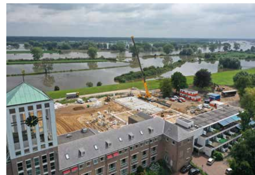
Zomer 2021: Achter de bestaande bouw is begonnen met de nieuwbouw. Door de hoge waterstand is de rivier buiten haar oevers getreden, waardoor delen land onder water zijn komen te staan. Gelukkig zonder gevolgen voor de speciaal aangelegde weg voor het bouwverkeer.

Schijfstraat 12, 5061 KB Oisterwijk | 0416 669 999 | info@klictet.nl | www.klictet.nl