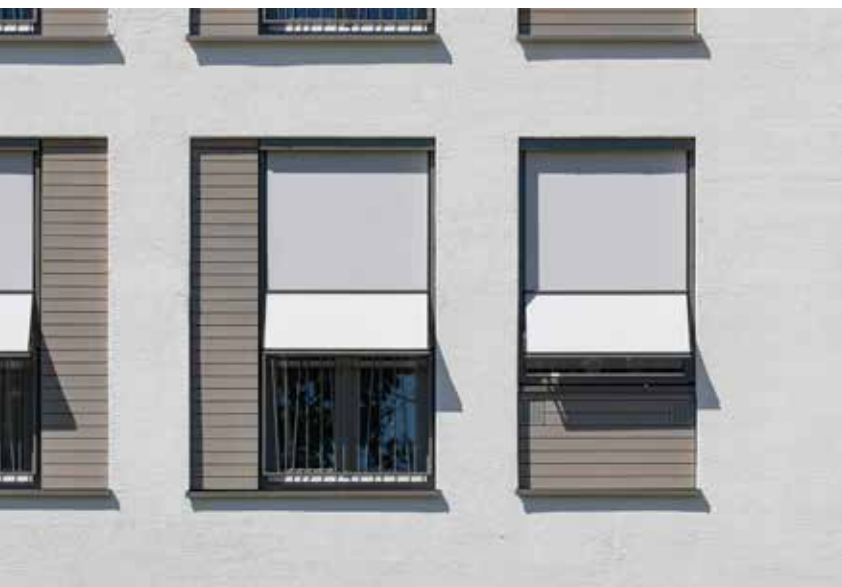
Rechtstreekse luchtkanalen via de gevel, een esthetisch mooie oplossing.

ClimaRad gaat verder dan slechts het aanleveren van het systeem. "We werken nauw samen met de installateur om het systeem optimaal te laten werken, naar de wens van de opdrachtgever en gebruiker. Dat doen we vooraf, maar ook tijdens de bouw of na oplevering. Indien gewenst kunnen settings op afstand gewijzigd worden en leggen wij de gebruiker uit hoe het systeem functioneert. Een stukje extra service." ■