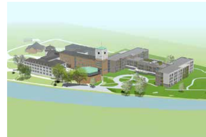
Schets van de eindsituatie met duidelijk zichtbaar H-vormig gebouw; een mooie verbinding tussen de gelegen binnenhoven en het Maasheggen landschap. (Beeld: Bouwbedrijf Berghege)

'Door contact met daglicht en groen is een healing environment gecreëerd'