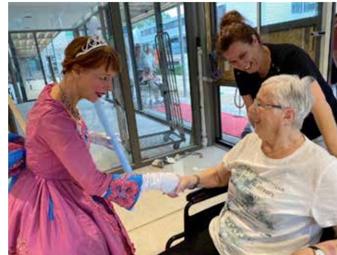
De eerste bewoners die zijn verhuisd maakten hun entree over de rode loper en werden ontvangen door een markiezin.

Door het toepassen van slimme zorgtechnologie ervaren bewoners in de eindsituatie straks meer vrijheid, terwijl medewerkers makkelijker en efficiënter kunnen werken en monitoren. Het leven speelt zich nu meer af in de huiskamer van de woongroep, met aangrenzende keuken, in plaats van in de slaapkamer. Het nodigt uit. Iedereen kan straks naar de beleefruimte of de brasserie. Toch is het voor de bewoners, voornamelijk ouderen met een vorm van dementie, goed te overzien. Bijvoorbeeld door het gebruik van kleuren en materialen. "Iedere woongroep heeft een eigen kleuren- en stoffenpalet. De woongroepen zijn allemaal vernoemd naar inheemse planten uit de Maasheggen. Zo voelt het al snel eigen, en herkennen de bewoners hun woonomgeving gemakkelijk."