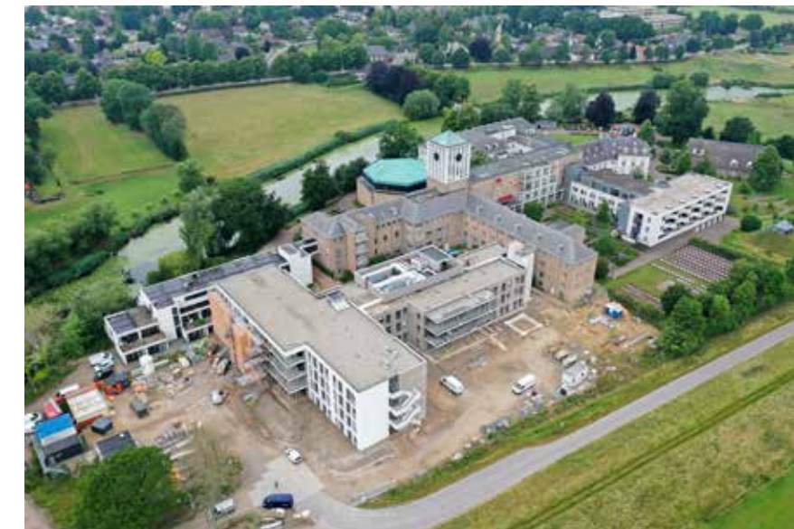
Zomer 2022: Overzicht van de huidige situatie; links vormt zich het uiteindelijke H-vormige gebouw.