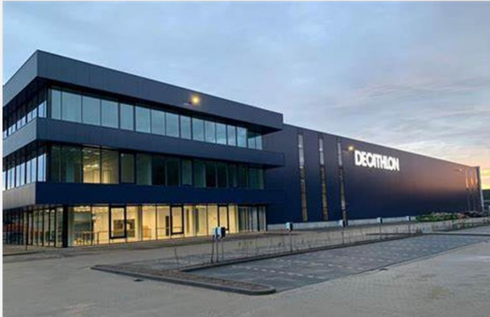
DC de Kroon (Fase 1 en 2) Tilburg