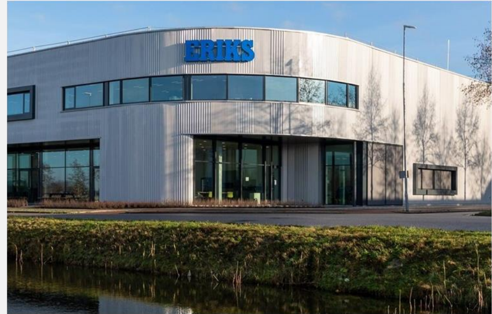
Eriks Kunststoffen Ede