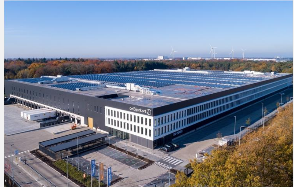
DC Ingram Micro Tilburg