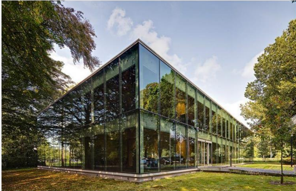
Renovatie BOM Tilburg