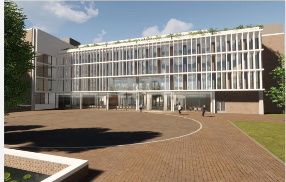
Huis van Roosendaal