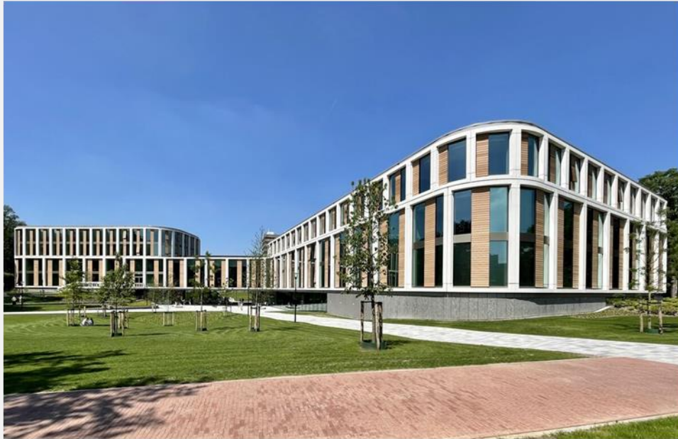
Fac. Soc. Wetenschappen Nijmegen