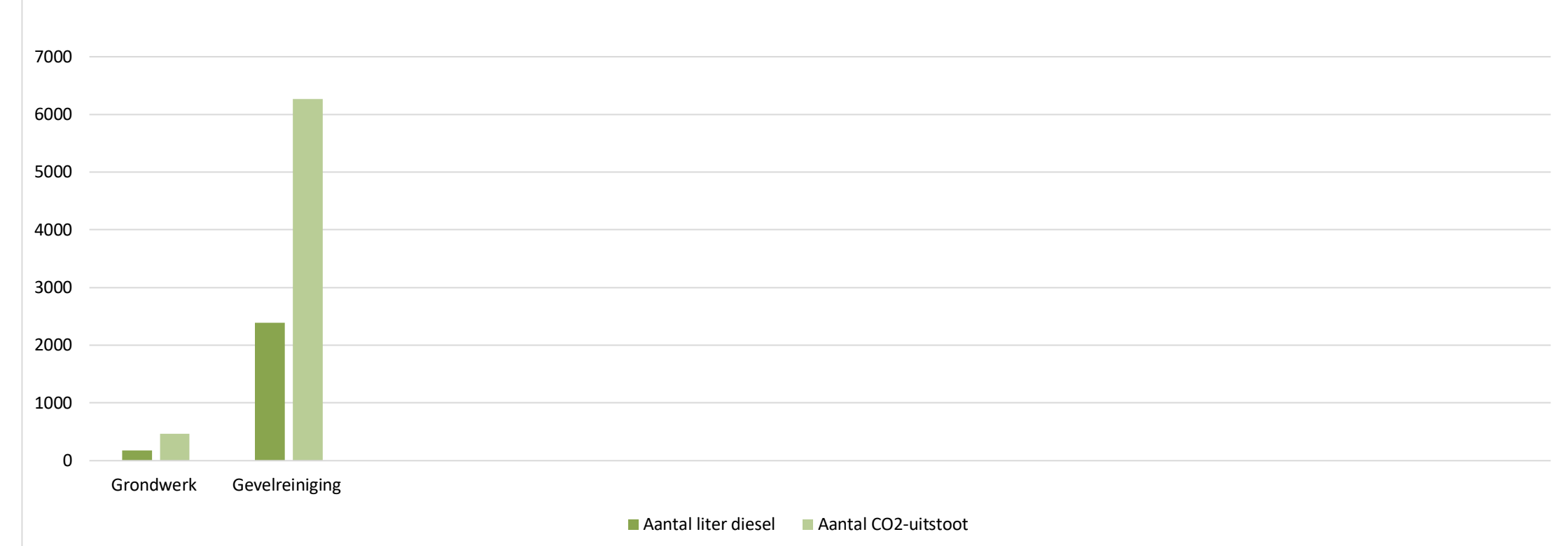
Grafiek 3: Gerealiseerd dieselverbruik aan de hand van machinegebruik op de bouwplaats inclusief de CO2-uitstoot.

Renovatie Tinbergen Gebouw - Campus Woudestein Erasmus Universiteit Rotterdam